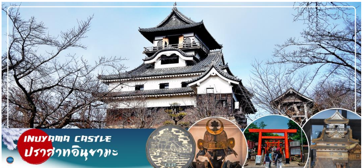
INUYAMA CASTLE ปราสาทอินยามะ

วันที่สอง ท่าอากาศยานนานาชาติซูบะเซ็นแทรร์ นาโกย่า – เมืองอินยามะ – ปราสาทอินยามะ(เข้าชม) – ศาลเจ้าซังโคอินาริ – ย่านเมืองเก่าอินยามะโจคามาริ – เมืองกิฟุ – อีออน มอลล์